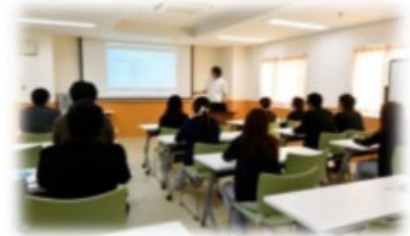
授業風景 (十全記念病院レクチャーホール)